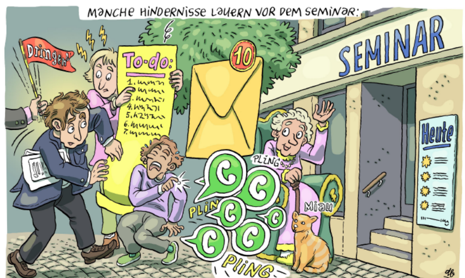
KARIKATUR: DANIEL BOSSHART

Einen Überblick über unser Seminarprogramm erhalten Sie auf der Rückseite dieses Updates. Es würde uns sehr freuen, Sie beim einen oder anderen Seminar begrüßen zu dürfen.