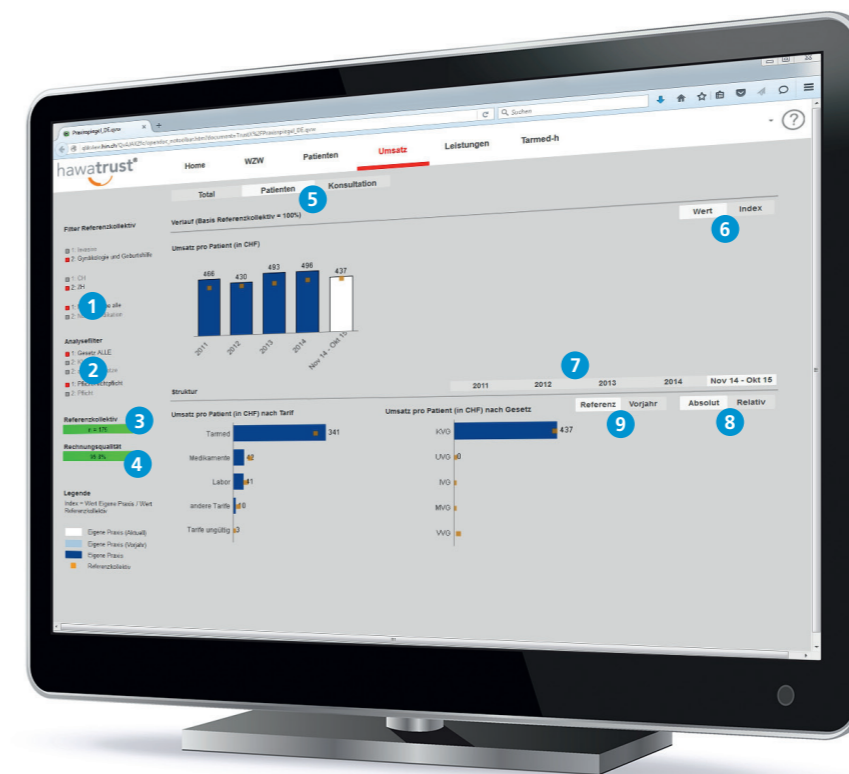
Intuitive und verständliche Auswertung dank logischem Aufbau und klarer Formensprache