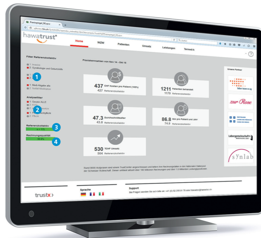
Einstiegsseite mit den wichtigsten Kennzahlen aus dem Praxisspiegel