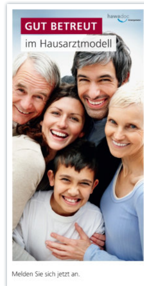
Broschüre «Gut betreut im Hausarztmodell»

Alle Praxen haben Ende August eine Grundausrüstung mit Broschüre, Plakat und Aufkleber erhalten. Plastiktaschen und Tablettenteiler werden gegen Bestellung versendet. Bitte nutzen Sie für abweichende Mengen und zusätzliche Werbemittel die untenstehende Antwortkarte.